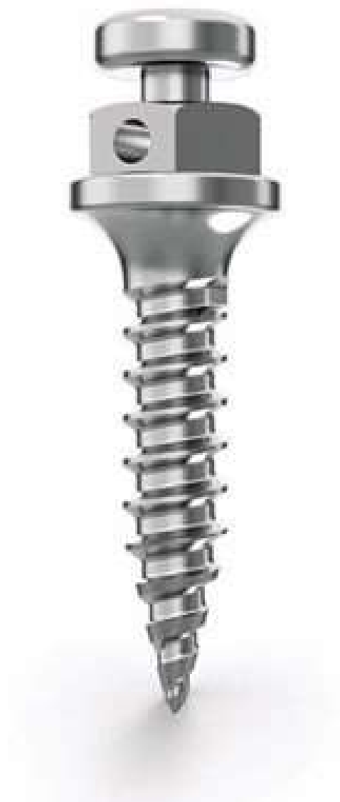
Imagem 01 – Parafuso de Miniimplante