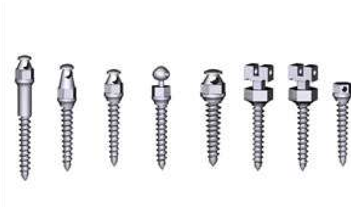
Imagem 04 – Tipos de parafusos de Miniimplantes