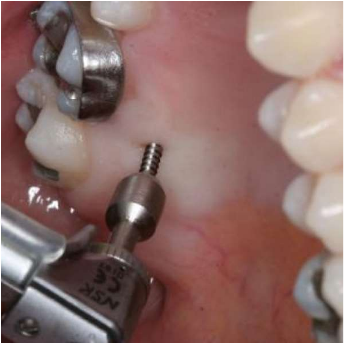
Imagem 02 – Instalação do Miniimplante