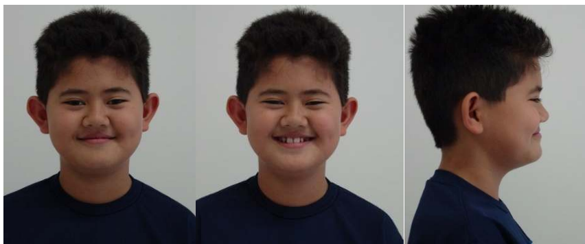
Figura 1 (A-C) - Fotografias extra bucais iniciais

Na análise extra bucal pôde-se observar simetria facial, selamento labial, terços facial inferior reduzido, ligeiro prognatismo mandibular e retração maxilar e perfil reto, ligeiramente côncavo (Fig. 1 A-C).