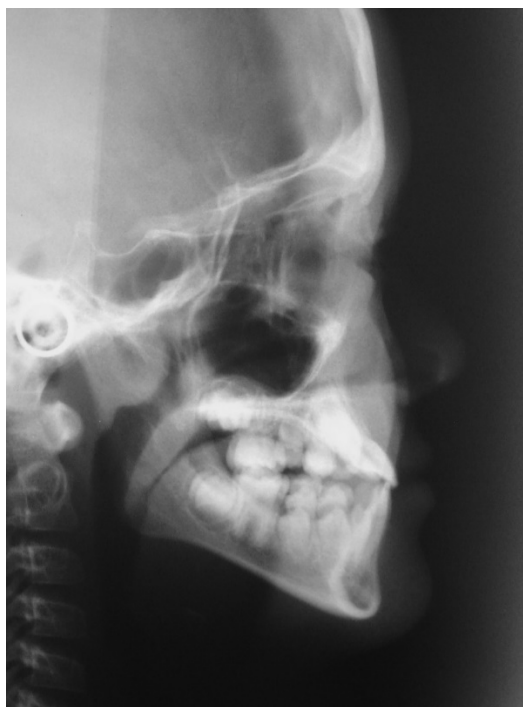
Figura 4(A)- Telerradiografia inicial

Na telerradiografia, notou-se vestibularização dos incisivos superiores, inclinação do plano palatino no sentido anti-horário e da mandíbula no sentido horário promovendo a ligeira retrusão do pogônio e deixando o perfil reto (Fig. 4A).