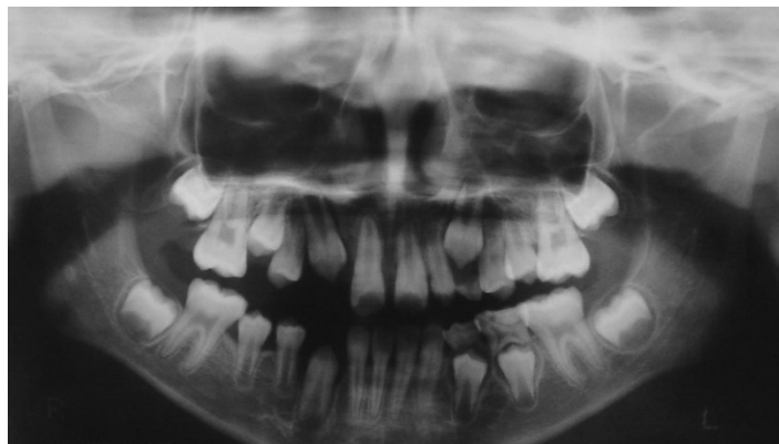
Figura 3(A) - Radiografia panorâmica inicial

Na radiografia panorâmica que foi realizada alguns meses antes iniciar o tratamento ortodôntico, observou-se aspecto de normalidade dos dentes e estruturas adjacentes, e a esfoliação dos decíduos 63, 74, 75 para posteriormente irrompimento dos permanentes e a confirmação da ausência do 12 (incisivo lateral superior direito) e 32 (incisivo lateral inferior esquerdo) (Fig. 3A).