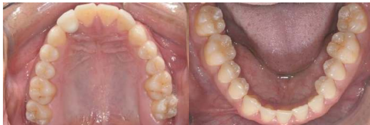
Figura 17 (A-E) - Fotos Intrabucais após 10 anos de tratamento