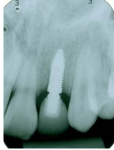
Figura 15(A)– Radiografias ao final do tratamento implante 12 (incisivo lateral direito superior)

E após 10 anos, desde o término do tratamento, podemos notar a estabilidade do tratamento quanto a má oclusão, sorriso e estruturas ósseas em um perfil harmônico após o crescimento (Fig. 16A-C, 17A-E, 18A-B).