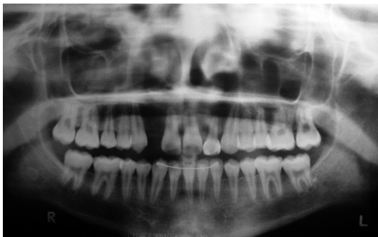
Figura 11(A-D) – Radiografias após o tratamento e o espaço para instalação do implante no 12 (incisivo lateral direito superior)