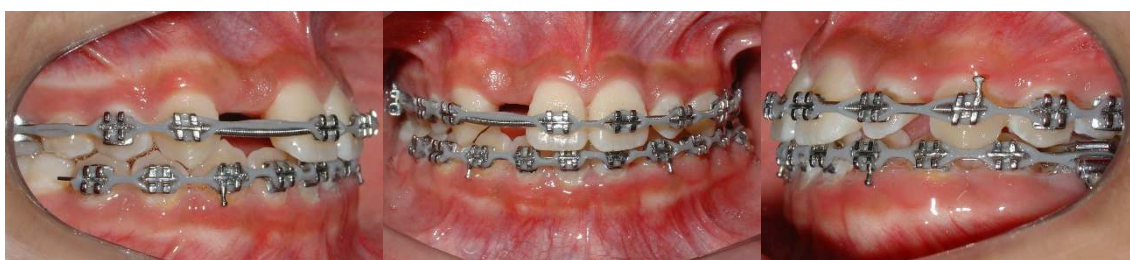
Figura 8 (A-C) – Após correção da discrepância transversal anterior e linha média e elástico cadeia para fechamento dos espaços remanescentes.

Após a correção das discrepâncias anterior posterior e linha média, foram utilizados elásticos em cadeia para o total fechamento de espaços remanescentes (Fig.8A-C).