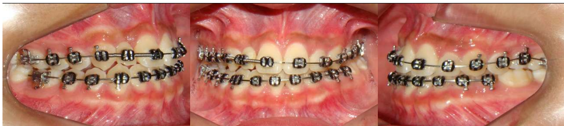
Figura 13 (A-C) - Recidiva da má oclusão e uso de elásticos por 8 meses

Durante 5 anos após o término do tratamento o paciente usou contenção removível superior com aparelho de Hawley e contenção fixa 3X3 inferior. Foram feitos nesse período acompanhamento de a cada 8 meses, até o paciente atingir a idade de 18 anos para instalação do implante na região do 12 (incisivo lateral direito superior) e notou-se recidiva. Introduzimos novamente o uso de elásticos intermaxilares 3/16 (força média) Classe III bilateral e realizados ajustes de contato prematuro (Fig. 13A-C).