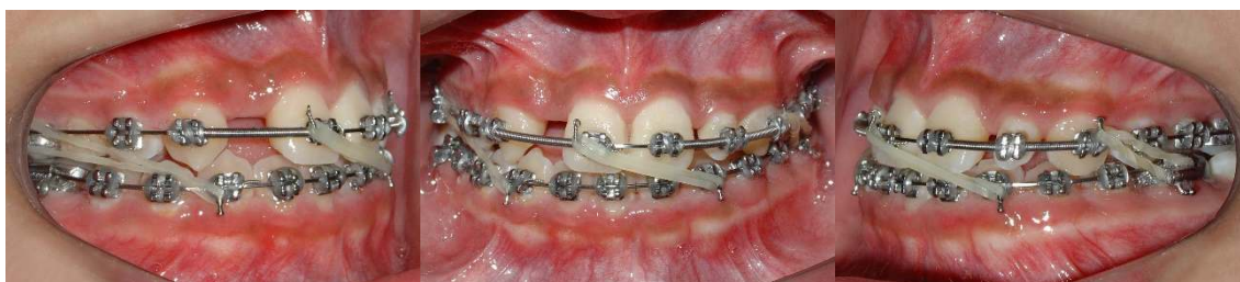
Figura 7 (A-C) – Correção da discrepância transversal anterior com elásticos oblíquos de linha média e anteroposterior classe III lado direito e classe II lado esquerdo

Dando continuidade a mecânica com o uso de elásticos intermaxilares 3/16 (força média) do lado direito para correção anteroposterior de Classe III e Classe II lado esquerdo e da linha média do 21 para o 32. (Fig.7A-C).