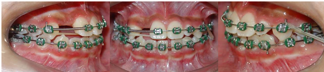
Figura 6 (A-C) – Correção da discrepância transversal anterior com elásticos oblíquos de linha média e anteroposterior Classe II lado esquerdo

forma oblíqua, entre os dentes 13 e 33 para a correção da discrepância transversal na região anterior. E consequente acerto das linhas médias dentárias em relação ao plano sagital mediano (Fig. 6A-C).