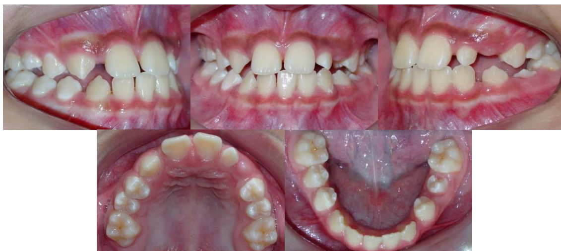
Figura 2 (A-E) – Fotografias intrabucais iniciais

Na análise intrabucal diagnosticou-se má oclusão de 1/4 Classe III bilateral, verificada em pré-molares e caninos, trespasse vertical (overbite) 1mm e trespasse horizontal (overjet) 1mm. Observou-se também linha média em relação ao plano sagital mediano, superior desviada para direita e inferior desviada para esquerda, devido as anomalias dentárias associadas.