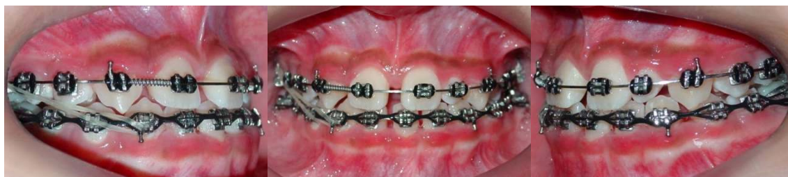
Figura 5 (A-C) - Fotografias Intrabucais após alinhamento e nivelamento

Inicialmente foram instalados os acessórios ortodonticos pré-ajustados da prescrição Roth, com slot .022"x.030" (Morelli Ltda, Sorocaba, São Paulo, Brasil). Nas fases de alinhamento e nivelamento foi utilizada a seguinte sequência de fios de níquel-titânio (NiTi) .014", .016", .018", .019"x.025" e mola aberta na região do 12 (incisivo lateral superior direito), elástico intermaxilar 3/16 (força média) Classe III do lado direito e elastico em cadeia na arcada inferior para fechamento dos diastemas (Fig. 5 A-C).