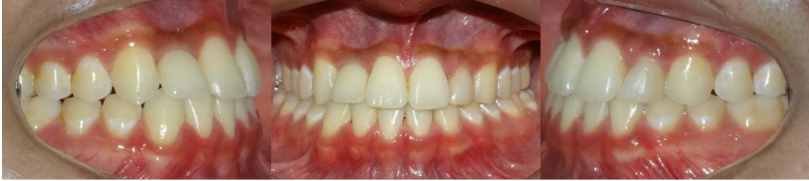
Figura 14(A-C) – Fotografias intrabucais após instalação do implante dentário (incisivo lateral direito superior)