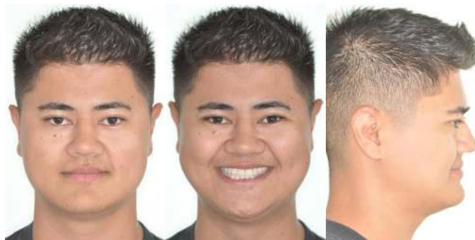
Figura 16 (A-C) – Fotos extrabucais após 10 anos de tratamento

E após 10 anos, desde o término do tratamento, podemos notar a estabilidade do tratamento quanto a má oclusão, sorriso e estruturas ósseas em um perfil harmônico após o crescimento (Fig. 16A-C, 17A-E, 18A-B).