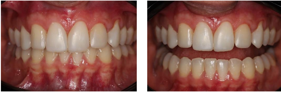
Figura 3 e 4 – Fotos finais após tratamento completo

Assim sendo, a importância da inter-relação e conhecimento entre as áreas da odontologia é fundamental visando produzir resultados satisfatórios, estéticos e biologicamente aceitos. Assim, a inter-relação dentística-periodontia é peça chave para a produção de procedimentos estéticos de altíssima qualidade e longevidade (CHALEGRE; BARBOSA; PAEGLE, 2018).