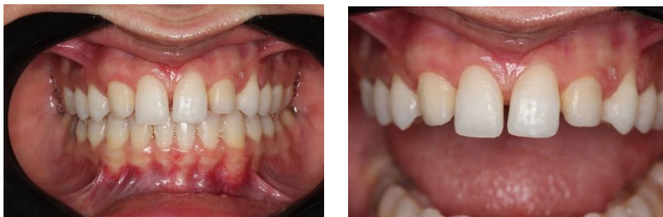
Figura 1 e 2 – agenesia dentária

As agenesias dentais estão relacionadas a anomalias de número, pode-se considerar uma sempre que após a avaliação clínica e visualizado a ausência de pelo menos um dente que por sua vez não tenha ocorrido por perda e/ou extração dentária, ou seja, está ausência se dá de forma genética e/ou congênita. (COSTA et al., 2004)