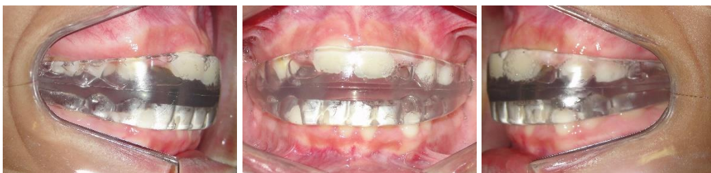
Figura 8(A-C) – Fotografias Intrabucais iniciais após a instalação do aparelho Occlus-o-guide

Afim de proporcionar uma melhora estética e funcional para a paciente, aproveitando a fase de crescimento da mesma, optou-se pelo aparelho Occlus-o-guide para servir de guia de erupção e correção do apinhamento e alinhamento dos arcos (Fig. 8 A-C).