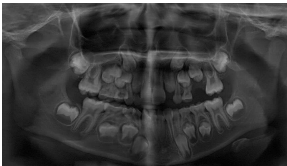
Figura 3 – Radiografia panorâmica inicial

Na radiografia panorâmica inicial, observou-se aspecto de normalidade dos dentes e estruturas adjacentes, manifestando estar no período intertransitório da dentadura mista. Verificou-se, ainda, a presença dos germes dos dentes permanentes dos laterais superiores, caninos, pré-molares e segundos molares favoráveis à irrompição (Fig. 3).