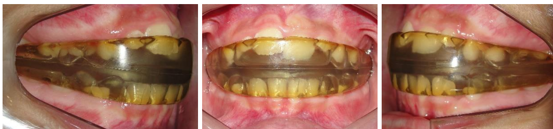
Figura 10(A-C) – Fotografias Intrabucais após sete meses de tratamento

Durante as consultas mensais, seguiu-se com as orientações para a paciente dos exercícios para se fazer durante o dia e o uso passivo todas as noites por mais seis meses (Fig. 10 A-C).