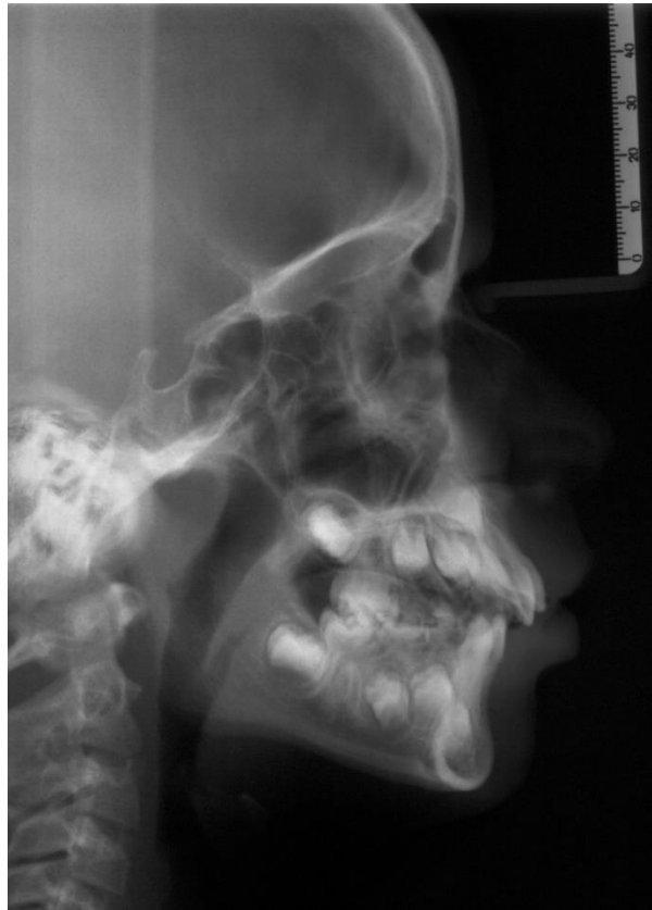
Figura 4 – Telerradiografia inicial