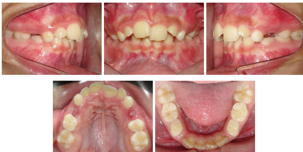
Figura 12(A-E) – Fotografias Intrabucais após doze meses de tratamento finalizando o uso do Occlus-o-guide.

Assim concluiu-se a primeira fase do tratamento interceptivo. A paciente foi extremamente colaboradora nessa fase do tratamento, visto que para o sucesso do mesmo é de suma importância a colaboração do paciente, assim como o incentivo dos pais e do profissional (Fig. 12 A-E).