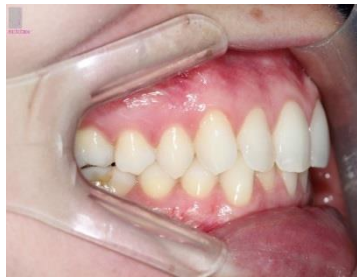
FIGURA 8 - Fotografia lateral direita

Foi exigência da paciente que o tratamento realizado fosse o mais estético possível. Sendo decidido então por instalar aparelhos linguais da marca ORMCO (7ª geração), sendo primeiramente realizada a colagem no arco superior. Após 15 dias foi instalado a aparelho autoligado no arco inferior. Para o sistema de transferência, foi realizado o Sistema Class. (Figuras 9, 10, 11, 12, 13).