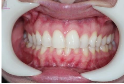
FIGURA 4 – Fotografia frontal inicial