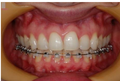
FIGURA 9 - Fotografia frontal durante o tratamento.

Foi exigência da paciente que o tratamento realizado fosse o mais estético possível. Sendo decidido então por instalar aparelhos linguais da marca ORMCO (7ª geração), sendo primeiramente realizada a colagem no arco superior. Após 15 dias foi instalado a aparelho autoligado no arco inferior. Para o sistema de transferência, foi realizado o Sistema Class. (Figuras 9, 10, 11, 12, 13).