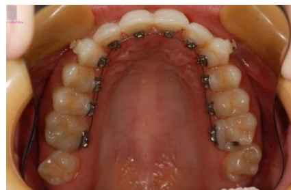
FIGURA 10 - Fotografia oclusão superior durante o tratamento.