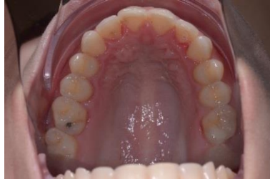
FIGURA 18 - Fotografia final oclusão superior