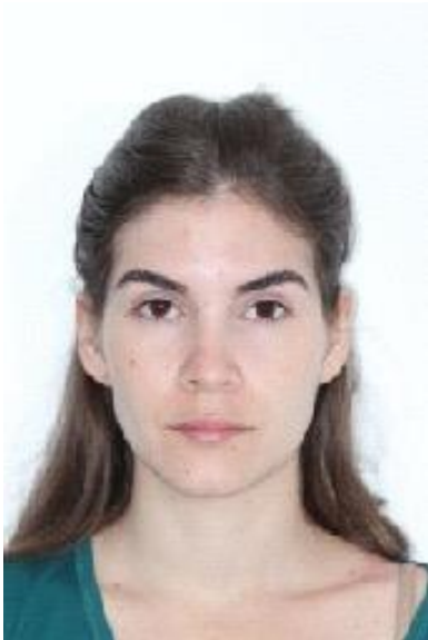
FIGURA 1 - Fotografia inicial da face (Frente).

Paciente do sexo feminino, com 25 anos e 1 mês de idade, compareceu para consulta em clínica do CPGO apresentando como queixa principal apinhamento anterior superior e inferior. A análise facial mostrou uma face padrão I simétrica, com perfil facial convexo e tendência a braquicefalico (crescimento horizontal). O ângulo nasolabial encontra-se normal. Apresenta normalidade dos tecidos moles e bom selamento labial. O exame clínico intrabucal mostrou uma relação dentária classe I com apinhamento anterior superior e inferior e suaves rotações. A linha média apresenta suave desvio inferior para o lado direito. A radiografia panorâmica mostrou que havia normalidade dos tecidos duros, denotando boa saúde periodontal, estavam presentes os terceiros molares inferiores, sendo o elemento 48 necessitando de exodontia. A análise cefalométrica demonstrou uma classe I esquelética, os incisivos superiores e inferiores vestibularizados. O diagnóstico foi de uma face com padrão I associada a classe I dentária com apinhamento anterior superior e inferior. (Figuras 1, 2, 3, 4, 5, 6, 7 e 8)