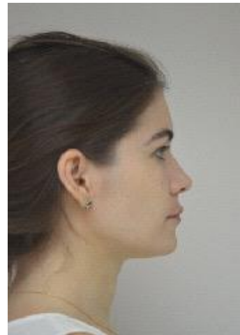
FIGURA 16 - Fotografia final da face (perfil).