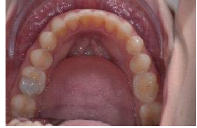
FIGURA 19 - Fotografia final oclusão inferior