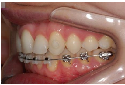
FIGURA 13 - Fotografia lateral esquerdo durante o tratamento.

Foi utilizada uma sequência de fios termoativados. O caso foi encerrado dentro das expectativas da paciente. As Figuras 14,15, 16, 17, 18, 19 e 20 mostram as fotos finais da paciente.