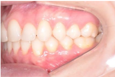
FIGURA 20 - Fotografia lateral esquerda final