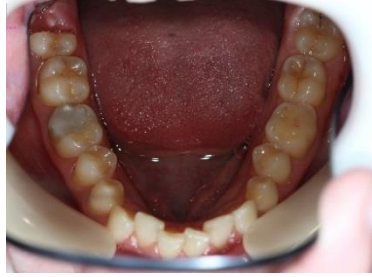
FIGURA 5 - Fotografia inicial oclusão inferior