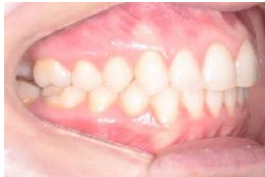
FIGURA 21 - Fotografia lateral direita final