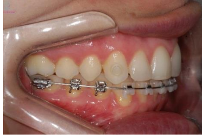
FIGURA 12 - Fotografia lateral direito durante o tratamento.