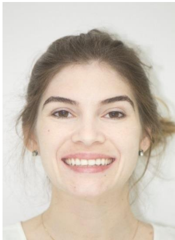
FIGURA 15 - Fotografia final com a paciente sorrindo.