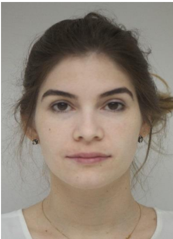
FIGURA 14 - Fotografia final da face (Frente).

Foi utilizada uma sequência de fios termoativados. O caso foi encerrado dentro das expectativas da paciente. As Figuras 14,15, 16, 17, 18, 19 e 20 mostram as fotos finais da paciente.