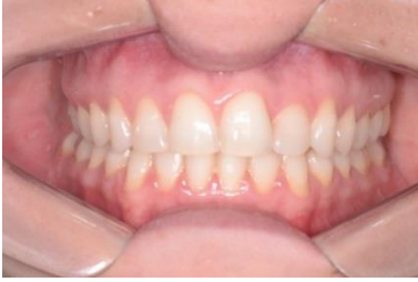
FIGURA 17 – Fotografia frontal final