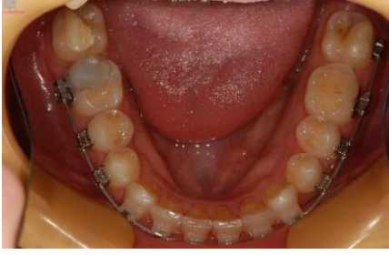
FIGURA 11 - Fotografia oclusão inferior durante o tratamento.