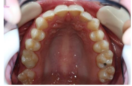
FIGURA 6 - Fotografia inicial oclusão superior