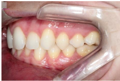
FIGURA 7 - Fotografia lateral esquerda