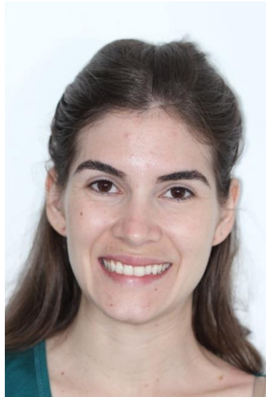
FIGURA 2 - Fotografia inicial da face.