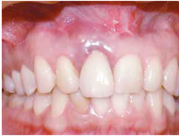
Figura 05 - Edema gengival na região do incisivo central superior direito.