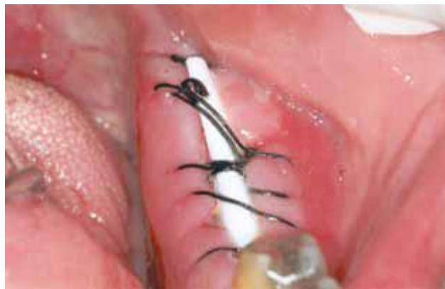
Figura 04 - Pós-operatório de sete dias. Mostra o aspecto saudável da gengiva e da barreira.