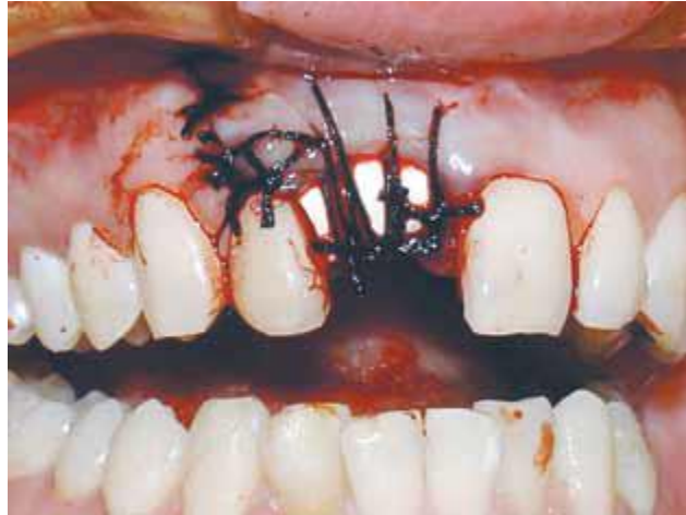
Figura 08 - Sutura sobre a barreira que ficou exposta ao meio bucal.