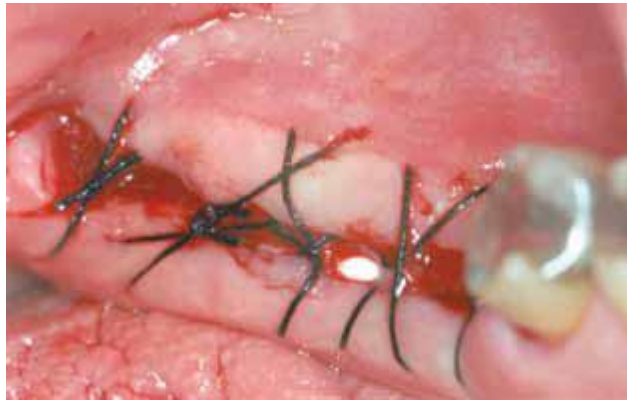
Figura 03 - Área suturada em que se observa a barreira.