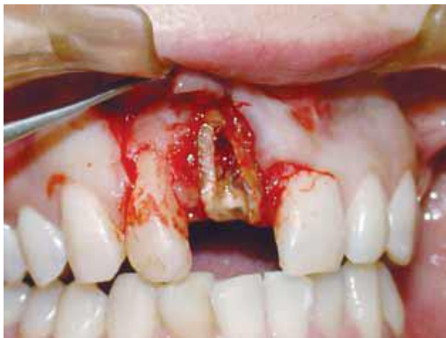
Figura 06 - Perda óssea causada pela fratura

Nesta paciente, não foi possível realizar uma avaliação precisa por meio do exame radiográfico. Assim, foi realizado um retalho total envolvendo os elementos 11 e 12, o que possibilitou ver uma fratura oblíqua que ultrapassava o terço médio da raiz do elemento 11. Praticamente toda a tábua óssea vestibular estava ausente.