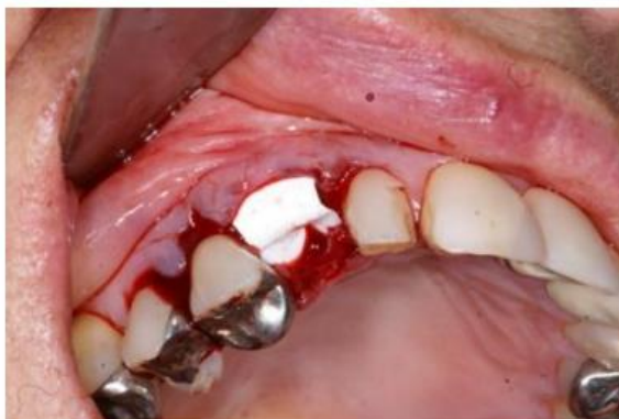
Figura 1 - Membrana de polipropileno contendo coágulo sanguíneo no alvéolo