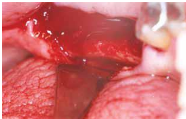
Figura 02 - Área do rebordo após as extrações dentárias

Abaixo, algumas imagens referentes a esse primeiro procedimento.