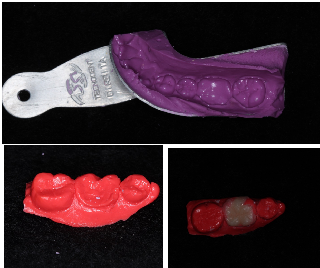
Figura 2: Molde com alginato, modelo com silicone para modelo e peça em resina composta sobre o modelo

Fez o acabamento e polimento da peça (Figura 8). No elemento 36 seguiram-se todas as etapas do elemento 46, quanto ao protocolo adesivo (Figura 9).