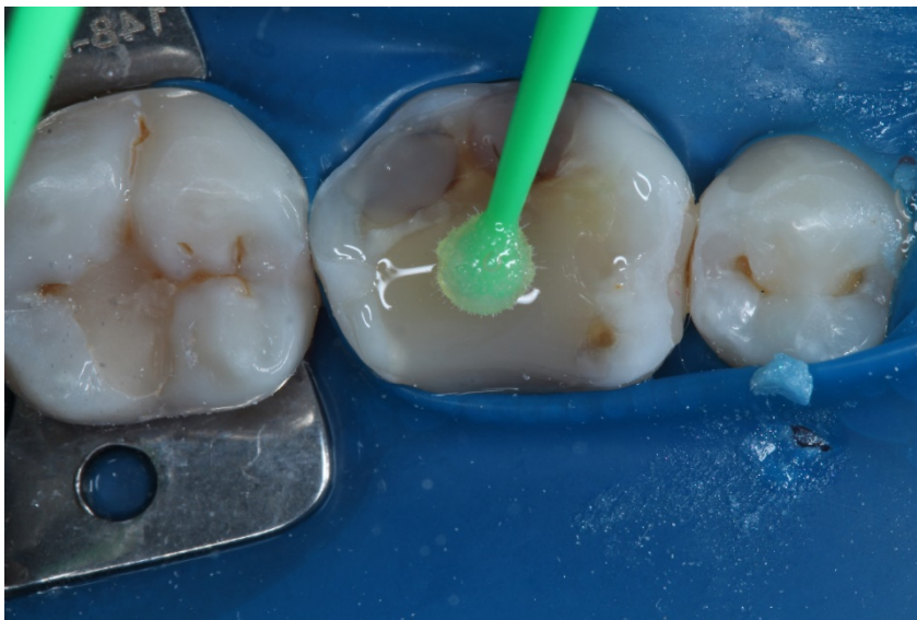
Figura 4 – Aplicação do Primer do sistema adesivo autocondicionante