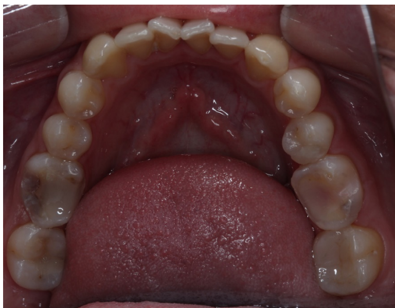
Figura 1: Biobase elementos 36 e 46, aspecto clínico intraoral

Em uma segunda consulta, prosseguiu-se com a cimentação adesiva. A peça foi provada no preparo referente a biobase e foi realizado os devidos ajustes para minimizar os ajustes oclusais após a cimentação. Em seguida, prosseguiu-se para o isolamento absoluto do campo operatório e profilaxia da área preparada. Preparou-se tanto o dente como a peça para cimentação adesiva.