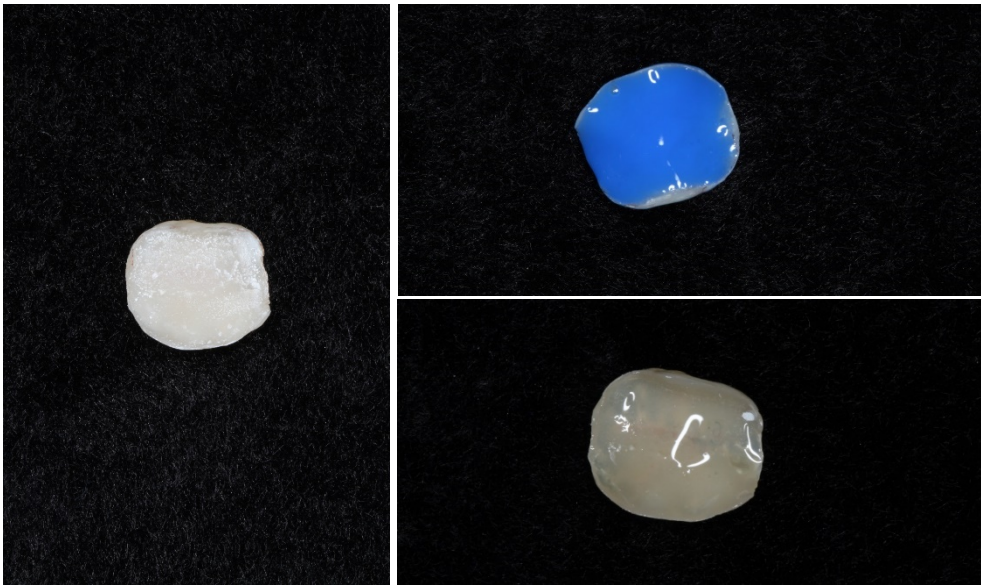
Figura 7 – Protocolo adesivo na peça em resina – Jateamento com óxido de alumínio; aplicação do ácido fosfórico, silano e sistema adesivo