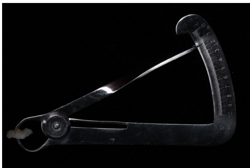
Figura 6 – Peça em resina composta confeccionada, sendo mensurada com especímetro.