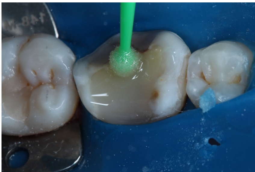
Figura 5 – Aplicação do Bond do sistema adesivo autocondicionante