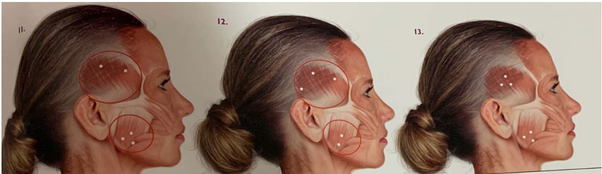
Figura 2- Imagem com diferentes pontos de aplicações:

Segundo LONG et al. A TxB-A, dosagem menores 100U, podem ser utilizadas clinicamente em pacientes saudáveis com DTM.