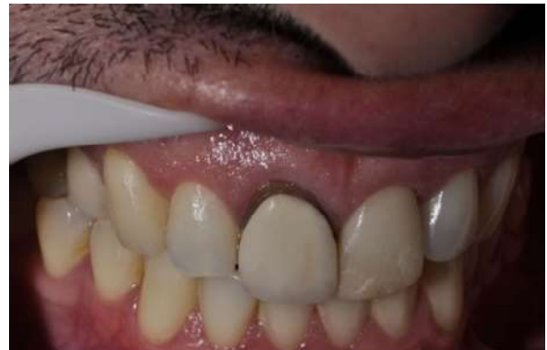
Fotografia 2 – Aspecto clínico inicial intraoral do paciente.