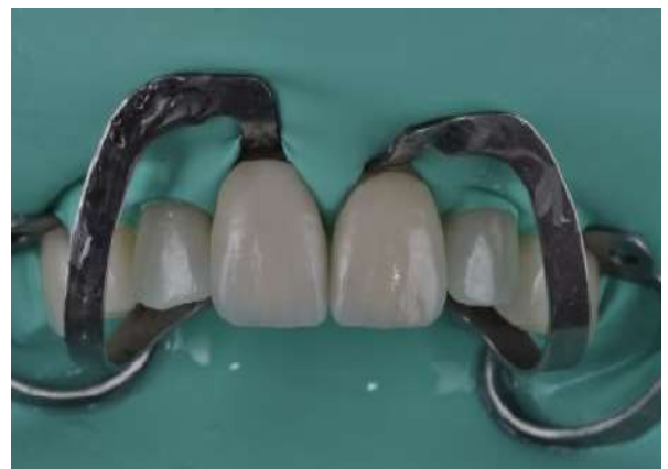
Fotografia 15 – Teste das facetas nos elementos 11 e 21.