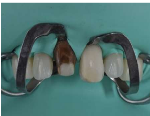
Fotografia 6 – Vista vestibular do isolamento