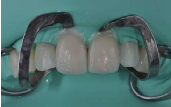
Fotografia 16 – Vista vestibular dos elementos cimentados.

Com as facetas bem adaptadas, realizou-se a aplicação do silano e a cimentação das duas facetas com o cimento resinoso Variolink esthetic (Ivoclar vivadent). E glicerina no término da restauração, seguido de fotoativação. (Fotografias 16 e 17).