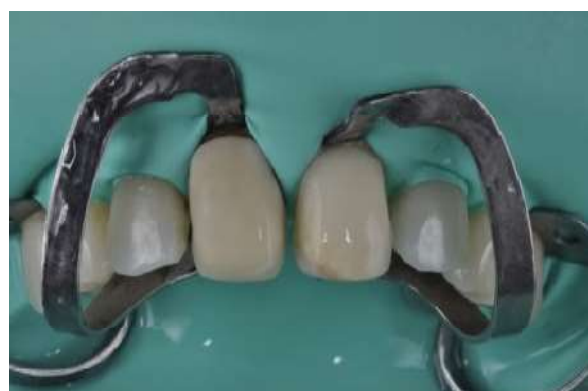
Fotografia 9 – Teste do coping na superfície seca