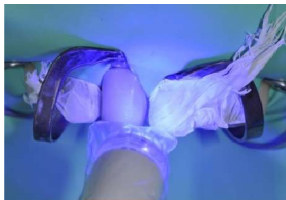
Fotografia 11 – Fotopolimerização do coping.