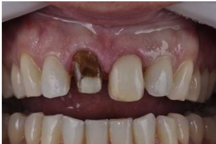
Fotografia 3 – elementos 11 e 21 após a remoção da coroa metalocerâmica e da resina composta

Após o planejamento inicial foi feita a remoção da coroa metalocerâmica do elemento 11, remoção da resina composta do elemento 21 e manteve-se o pino metálico do elemento 11 devido suas condições favoráveis. Em ambos foram feitos os preparos com brocas diamantadas (Ception), para receber o material protético selecionado, a sequência das brocas foram 1014 para delimitar término, 2200 para desgaste proximal, 3216 para união dos sulcos de orientação, 3118 para desgaste palatino e 4138 para acabamento e 2135 para o preparo da faceta, foi feita a confecção dos provisórios e em seguida realizado a moldagem com a técnica duplo fio com silicone de adição (Futura - FGM). (Fotografia 3).