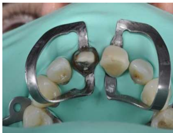
Fotografia 7 – Vista oclusal do isolamento