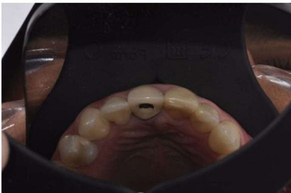
Fotografia 1 – Aspecto clínico inicial intraoral do paciente.

Na primeira etapa do plano de tratamento foram realizadas algumas fotografias para o planejamento estético do sorriso, por meio do digital smile design (DSD), enceramento e mockup. (Fotografias 1 e 2).