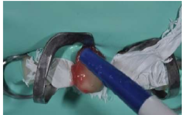
Fotografia 13 – Remoção do excesso do ácido fluorídrico a 5% com sugador.

Depois do condicionamento da superfície do coping de zircônia, foi realizado a limpeza da superfície do coping e condicionamento do elemento 21, ambos com ácido fosfórico a 37% seguido da remoção do mesmo com água abundante e feito o teste das facetas nos elementos 11 e 21 na superfície seca. (Fotografias 14 e 15).