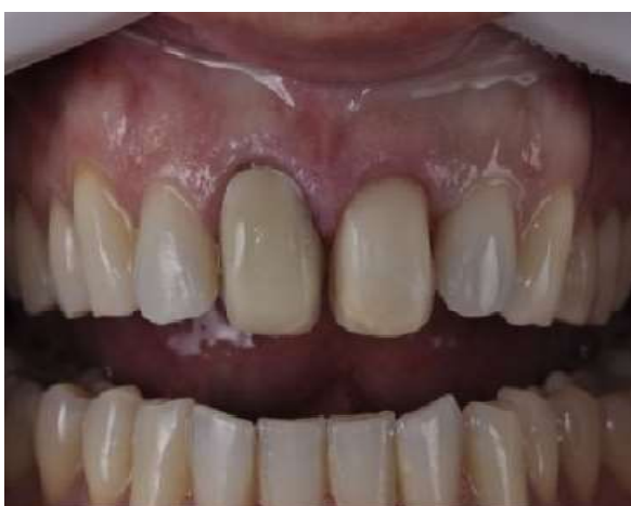
Fotografia 4 – Teste de adaptação do coping de zircônia no elemento 11.

Feito os preparos dos elementos dentários 11 e 21, foi realizado o teste do coping de zircônia na cor A2, com o objetivo de buscar a semelhança do substrato dentário do elemento 21 e para uma seleção mais precisa da cor do cimento. (Fotografia 4). A faceta de dissilicato de lítio também foi selecionada a cor A2. (Fotografia 5). Em seguida, realizou-se o isolamento absoluto para evitar que umidade no local comprometesse a cimentação e também uma modificação no grampo 212 para melhorar a adaptação na região cervical facilitando a visualização no momento da cimentação. (Fotografias 4, 5, 6 e 7).