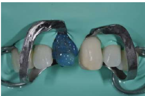
Fotografia 8 – Condicionamento com Ácido Fosfórico a 37%.

Com o teste do coping, da faceta e do isolamento absoluto já realizados, precedeu-se a aplicação de uma camada de cerâmica de cobertura no coping de zircônia pelo protético, para uma melhor adesão na superfície no momento da cimentação e em seguida o condicionamento do elemento dentário 11, com ácido fosfórico a 37% (Condac – FGM), por 30 segundos e removidos com água pelo dobro de tempo do condicionamento ácido. (Fotografia 8). Na próxima etapa foi feito o teste do coping na superfície seca, seguido da aplicação do sistema adesivo (Adesivo da Ivoclar) e cimentação com o cimento Variolink esthetic (Ivoclar vivadent), polimerizado por 40 segundos. (Fotografias 9, 10 e 11).