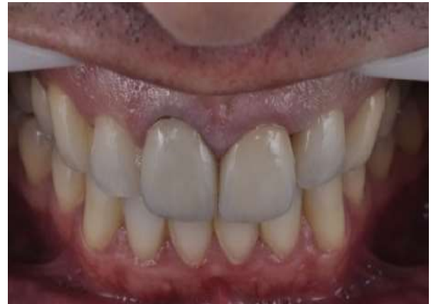
Fotografia 19 – Elementos dentários 11 e 21 após a reabilitação.