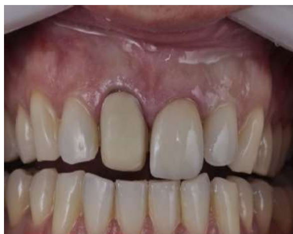
Fotografia 5 – Teste de adaptação da faceta no elemento 21.