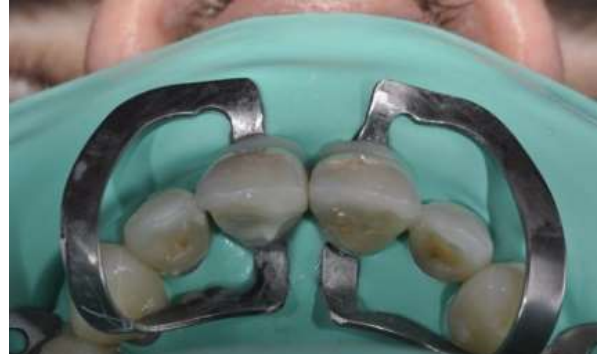
Fotografia 17 – Vista oclusal dos elementos cimentados.

Resultado após a cimentação dos elementos dentários 11 e 21 do antes (Fotografia 18) e depois (Fotografia 19).