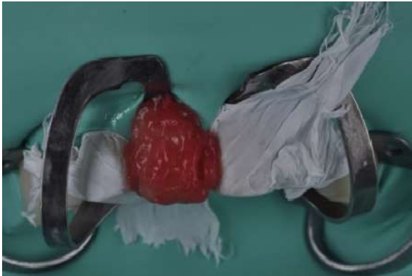
Fotografia 12 – Condicionamento com ácido fluorídrico a 5% do coping no elemento 11.

Após a finalização da cimentação do coping, o mesmo foi condicionado com ácido fluorídrico a 5% (Condac – FGM), por 20 segundos seguido de remoção do excesso do ácido com sugador e com água abundante. (Fotografias 12 e 13).