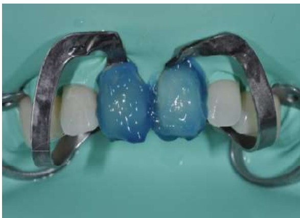
Fotografia 14 – Limpeza com ácido Fosfórico a 37% do elemento 11 e para condicionamento do elemento 21.

Depois do condicionamento da superfície do coping de zircônia, foi realizado a limpeza da superfície do coping e condicionamento do elemento 21, ambos com ácido fosfórico a 37% seguido da remoção do mesmo com água abundante e feito o teste das facetas nos elementos 11 e 21 na superfície seca. (Fotografias 14 e 15).