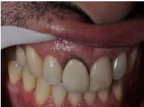
Fotografia 18 – Elementos dentários 11 e 21 com o trabalho antigo.

Resultado após a cimentação dos elementos dentários 11 e 21 do antes (Fotografia 18) e depois (Fotografia 19).