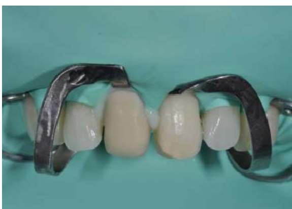
Fotografia 10 – Cimentação do coping no elemento 11.